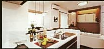
【ハイオープンキッチン】

キッチンはハイオープンタイプなので、LDにいるご家族の姿を常に感じ、お料理しながら会話を楽しめます。