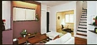
【リビングアクセス階段】

「おはよう!」「ただいま!」などの会話が生まれるように、LDに階段を配置した、家族のふれあいを生むプランです。