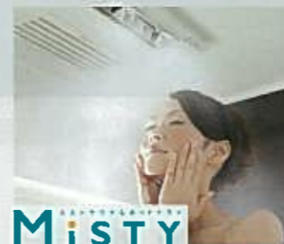
ミストサウナでリフレッシュ