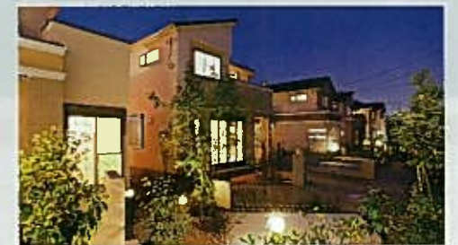
夜でも安心できる照明計画

グレースヴィラ満和園(2010年8月撮影) 夜の街を明るく保つ照明計画で、街全体の安全性を向上。発光のお子さまも安心して歩行できる街となりました。