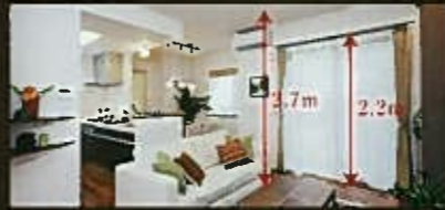
【ハイシーリング&ハイサッシ】

2.7mの天井高を確保している開放的なリビング。2.2mの大きな開口部からは明るい光が訪れ、心地よさを高めています。