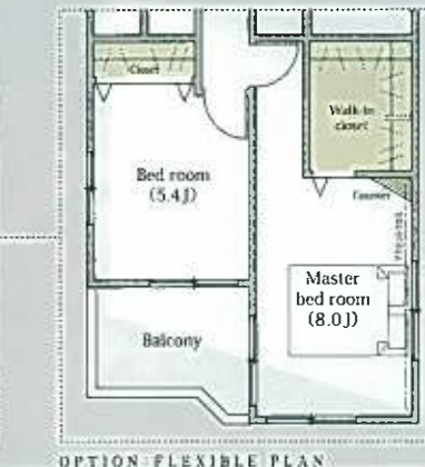
OPTION FLEXIBLE PLAN

カフェスペースとして楽しめるテラスをご用意。プランターを置けば家庭菜園としても利用できます。