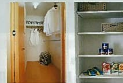
充実の収納でお部屋すっきり

老廃物を洗い流し、お肌がしっとりとうるみサウナは、全身浴に比べ体の負担が少ないというメリットもあります。